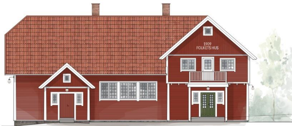
Fasaden mot Nissadalsvägen, efter en tänkt renovering. Bild: Liljequist Arkitekter.