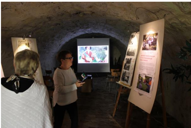
Foto från ”invigningen” av jordkällaren 10 september, då det i källaren pågick en filmvisning och visades en utställning om gränstenen Knystahall.

Under årets återstående månader sattes också en nytillverkad dörr in i Pumphuset. Även Fryshuset har fått ny dörr och ett nytt fönster.