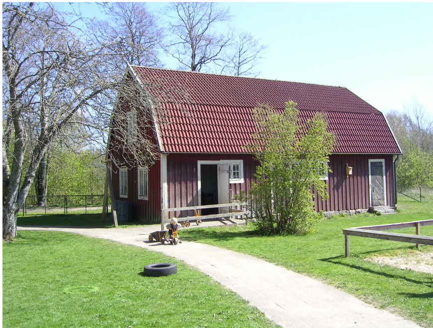
Bild 3 och 4. Kinnareds gamla prästgård och dess ekonomibyggnad.