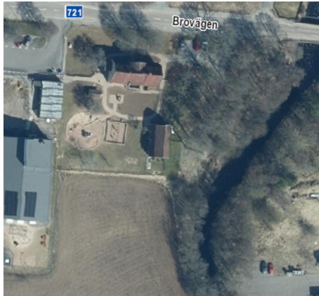
Bild 5. Ortofoto över planområdet.

Planområdet är beläget centralt i Kinnareds samhälle. Väster om planområdet finns idag en förskola samt skola som fortsatt planeras att verka på platsen. Därav är det viktigt att kommande förändringar i planområdet inte påverkar skolans verksamhet negativt, både gällande skolans fysiska plats men även platser så som trottoaren mellan Brovägen och planområdet som barn använder för att ta sig till och från skolan. Utfart ifrån planområdet bör därför ej flyttas eller bli fler. Eftersom Brovägen är en statlig väg regleras detta i väglagen. För att inte störa skolans verksamhet är det satt en högsta nockhöjd på sju meter för eventuella nya byggnader, nya byggnader får inte placeras närmre än 4,5 meter ifrån fastighetsgränsen, det är satt en begränsning av högsta byggnadsarea. En annan planbestämmelse reglerar dessutom att verksamhet inte får vara störande för omgivningen. I närheten av planområdet ligger förutom skolan olika verksamheter såsom affärer och fabriker. Det är önskvärt att kommande användning på platsen bidrar till samhällets utveckling.