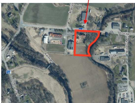
Bild 2. Översiktlig bild av aktuellt planområde.