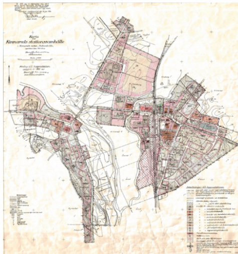
Bild 6. Gällande detaljplan.

För aktuellt planområde gäller detaljplan Ki 502 Kinnareds stationssamhälle från 1953. Gällande detaljplan medger idag allmänt ändamål på platsen. Befintlig detaljplan upphävs där det nya planområdet är placerat i samband med att den nya detaljplanen lagar kraft. Utanför det nya planområdet kommer dock detaljplanen Ki 502 Kinnareds stationssamhälle fortfarande vara gällande.