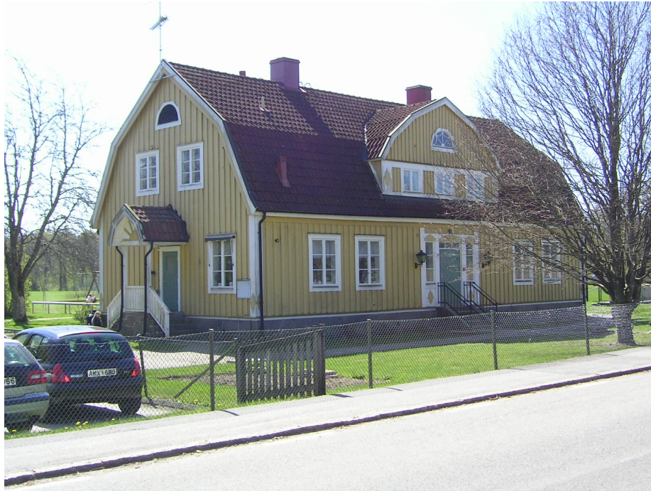
Bild 6. Kinnareds gamla prästgård.