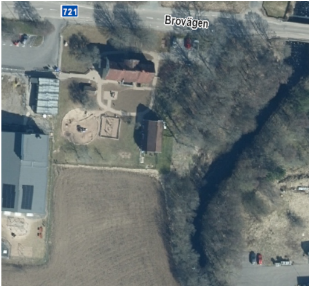
Bild 3. Ortofoto över planområdet.