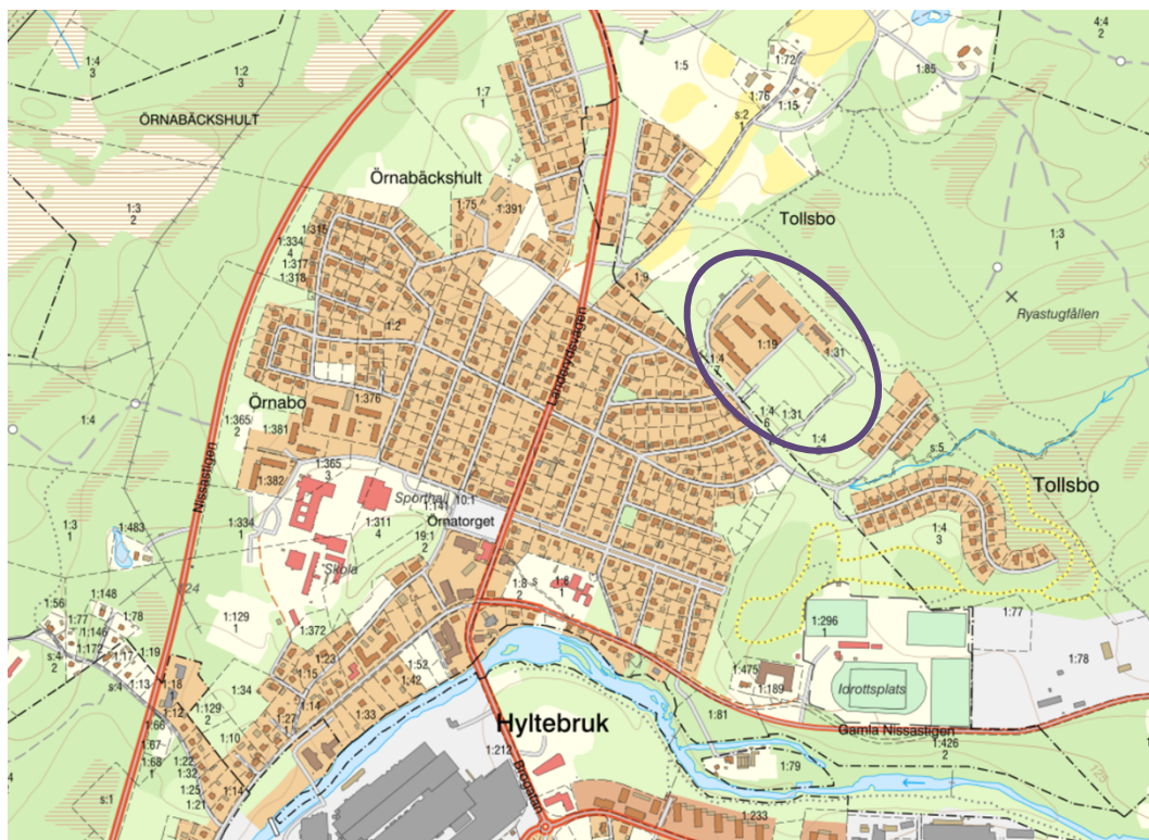
Kartan visar läget för Tollsbo 1:19 och 1:31 i Hyltebruk.