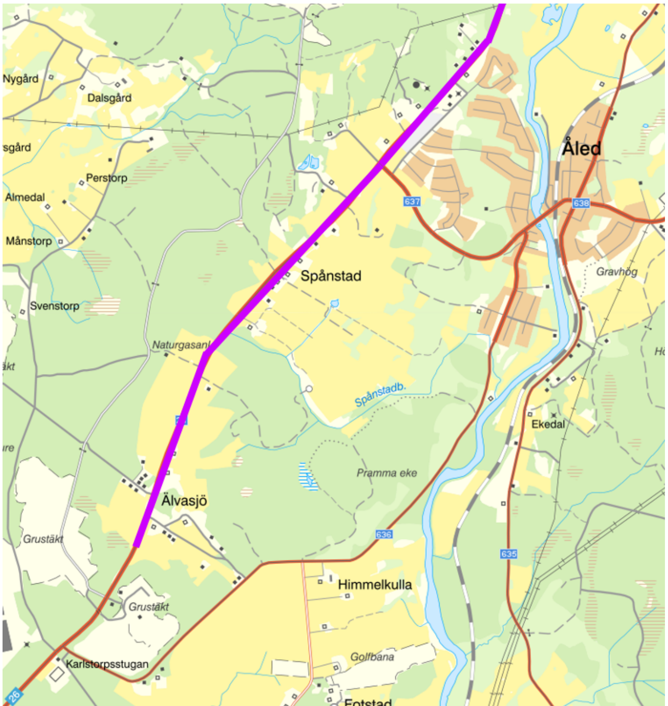
Kartbild 2: Delsträcka hastigheten justeras till 80km/h, 800 meter norr om väg 636.