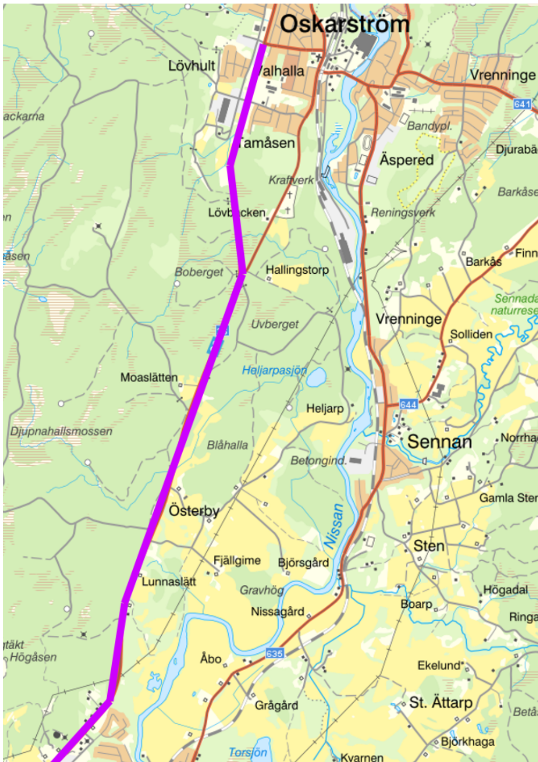
Kartbild 3: Del sträcka där hastigheten justeras från 90 km/h till 80 km/h, tills korsningen med väg 640.