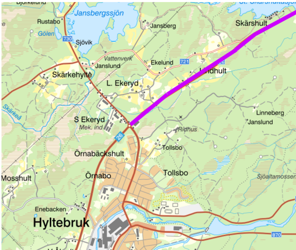
Kartbild 4: Delsträcka där hastigheten sänks från 90 km/h till 80 km/h, från korsningen väg 730/871 och norr ut.