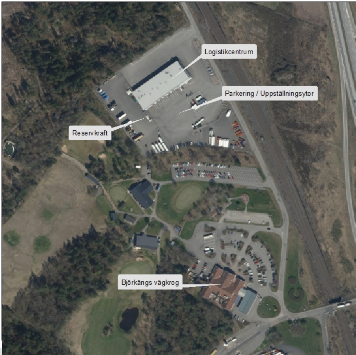
Bild 2. Logistikcenter i Himle