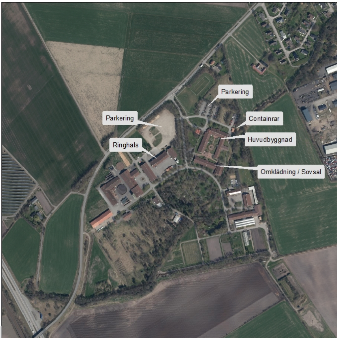
Bild 1. Länsstyrelsens fältplats på Munkagårdsgymnasiet.