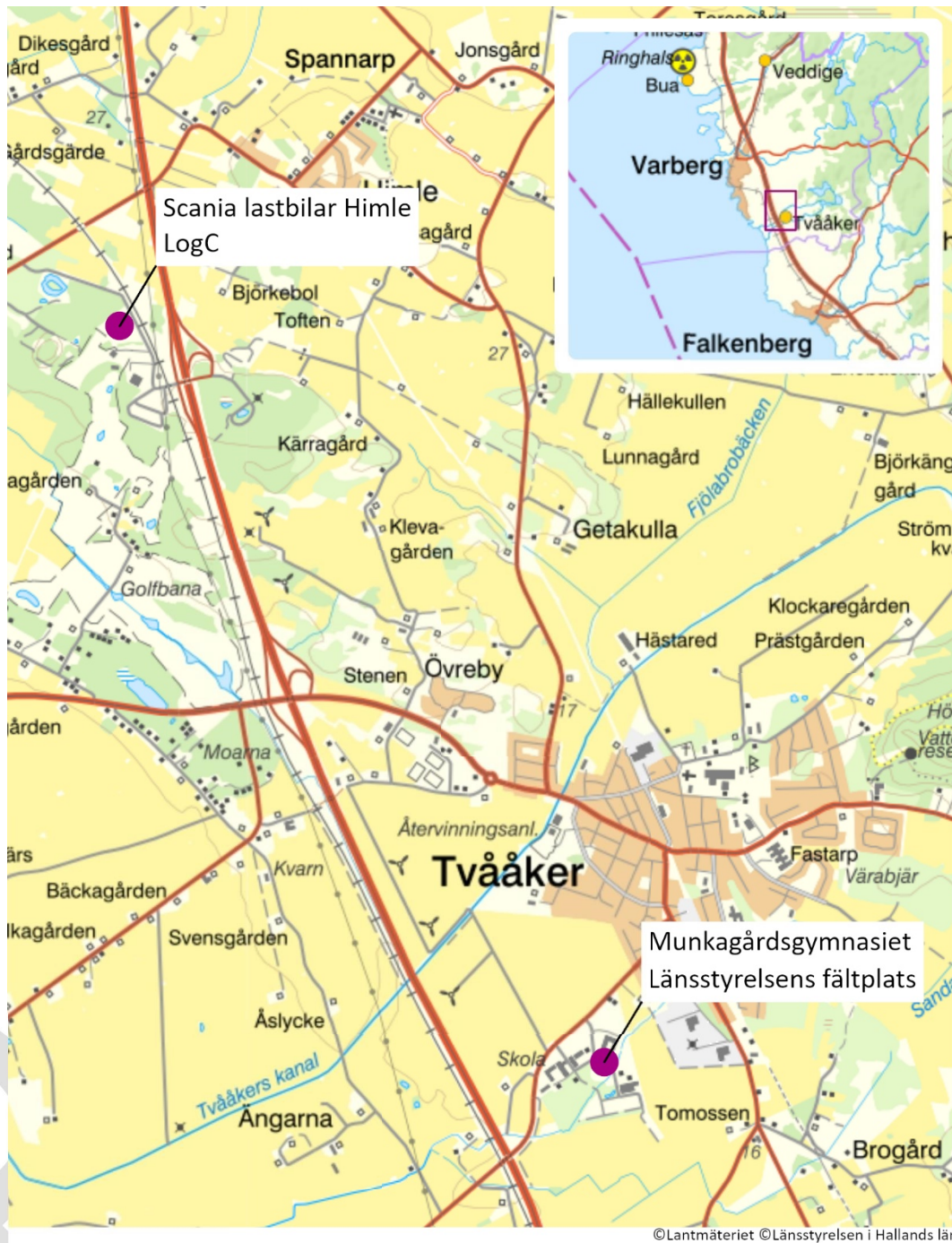
Bild 3. Placeringen av Logistikcenter i Himle och Länsstyrelsens fältplats på Munkagårdsgymnasiet.