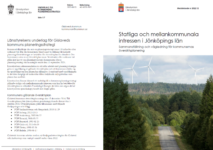
Figur 2: Förstasidorna av Länsstyrelsens planeringsunderlag till Gislaveds kommun.

Den nya lagstiftning som Länsstyrelsen omnämner i sitt yttrande till Gislaveds kommun är den nya lagstiftningen för översiktsplanering samt beredskap för klimatförändringar i plan- och bygglagen (PBL) och förändringarna kring miljöbedömningar och miljökvalitetsnormer i miljöbalken (MB) samt införandet av barnkonventionen i svensk lag.