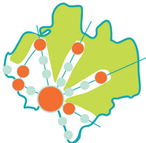
Alternativ 1 – schematisk bild över orter som planeras växa

Alternativ 1 innebär att servicesamhällena växer kraftigt med bostäder och service. Dessa orter ligger samlade längs stråk tillsammans med mindre orter som byggs ut i betydligt mindre omfattning. Staden Halmstad växer.