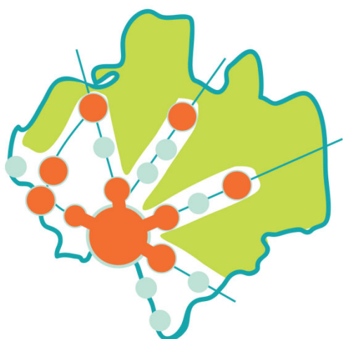
Alternativ 2 - schematisk bild över orter som planeras växa

Alternativ 2 innebär att orterna i stadens krans byggs ut och växer samman med staden. Även servicesamhällena växer kraftigt med bostäder och service. Staden Halmstad växer. Att bygga ut orterna i stadens krans har fördelar eftersom förutsättningar för hållbara transporter är goda och lägena är attraktiva. Utbyggnaden kommer dock att ta jordbruksmark i anspråk.